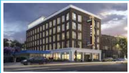
Curbed Chicago, May 30, 2018